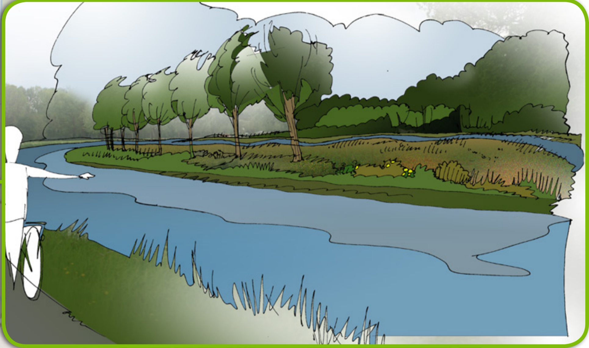
NOTSEL: EXTRA MEANDER TEGEN BOSJE OP OOSTOEVER, OUDE LOOP BLIJFT LIGGEN