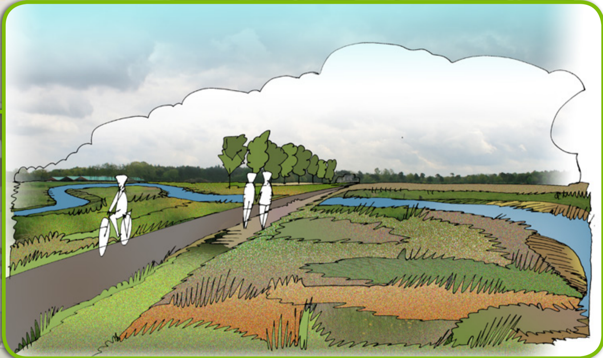
BIJ BOSJE GALDER: FIETSPAD EN DROGE ECOLOGISCHE VERBINDINGSZONE RICHTING STRIJBEEKSEWEG