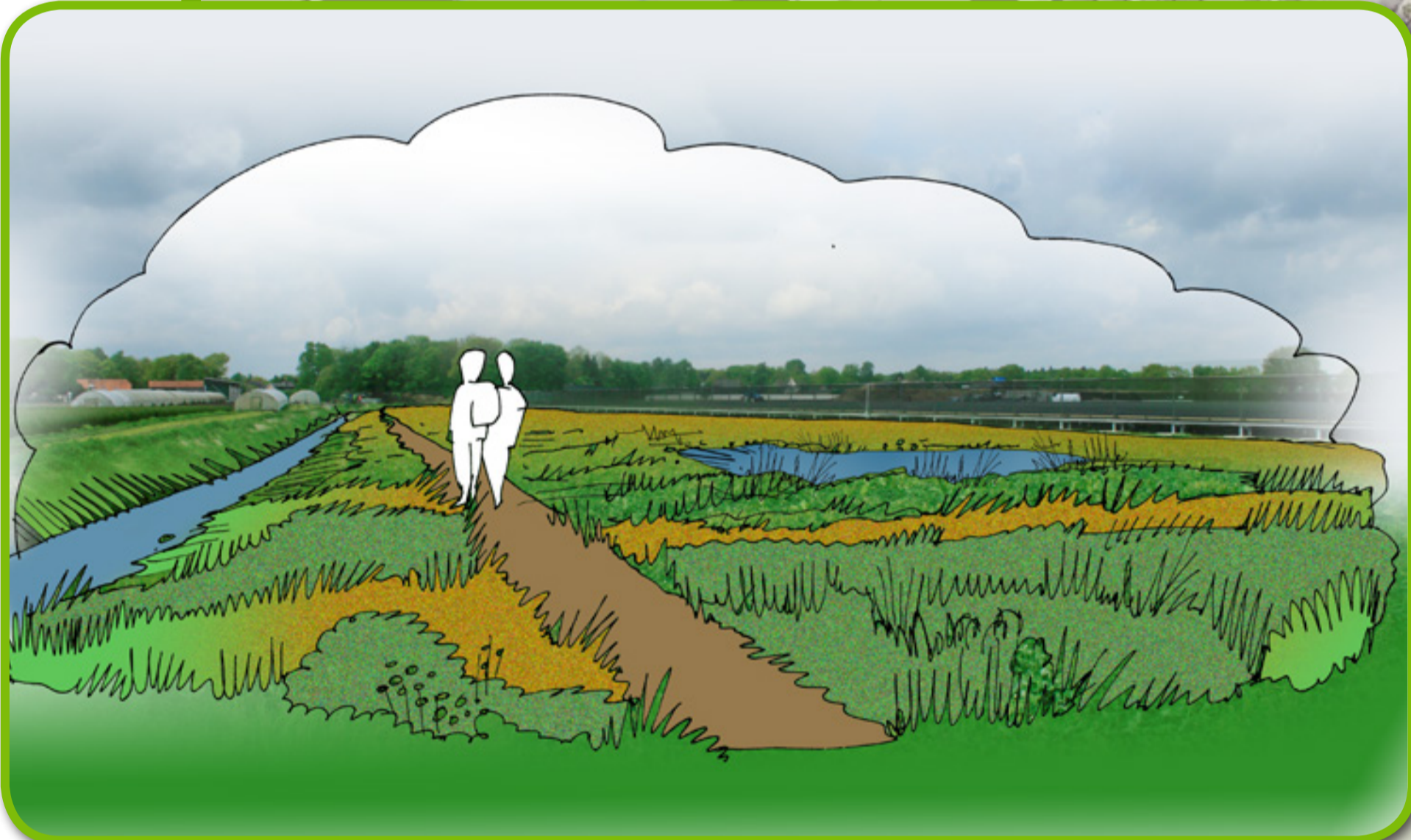
ECOLOGISCHE VERBINDINGSZONE LANGS KERZELSE BEEK OP TERREIN AARDBEIENPLANTENTELER