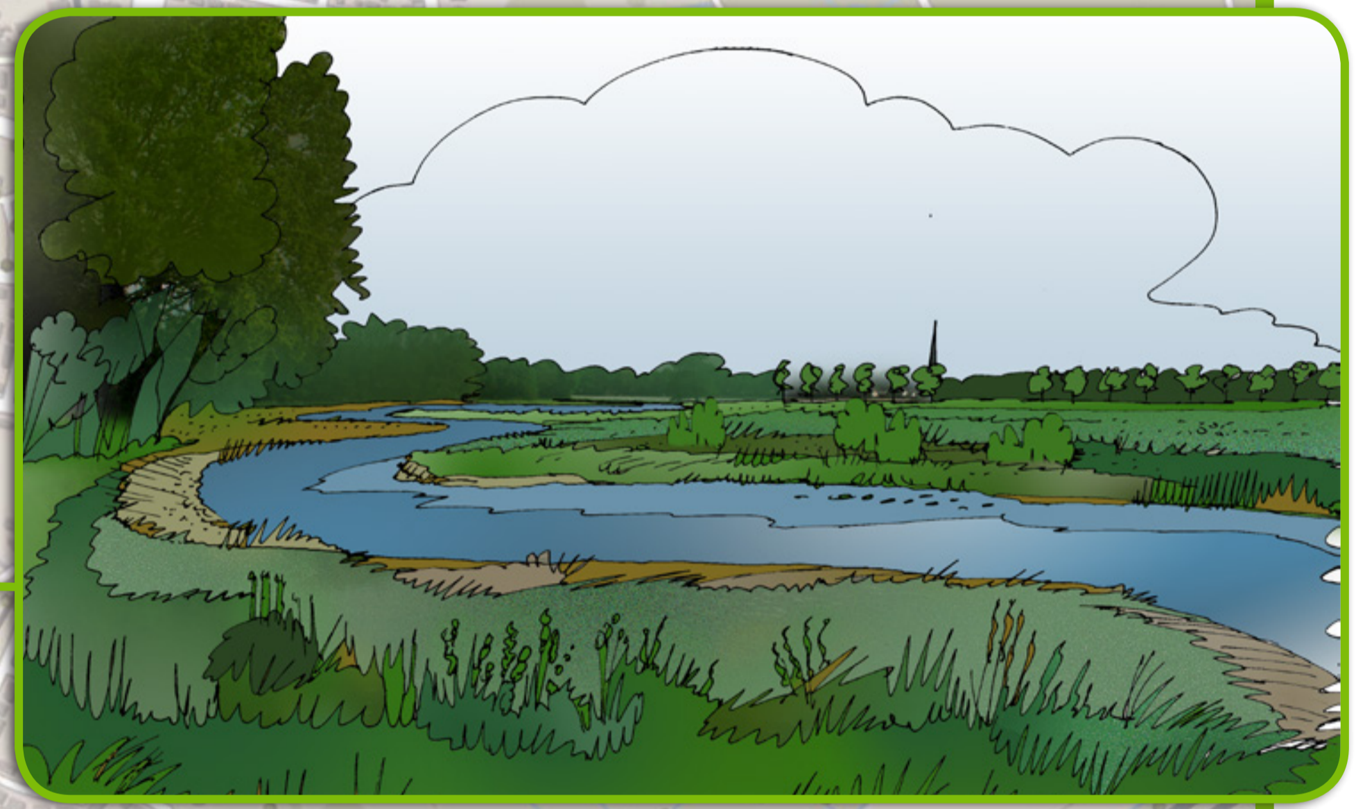
STUW BLAUWE KAMER EN OUDE LOOP VERDWIJNEN, NIEUWE MEANDERS OP WESTOEVER MET VOCHTIG HOOLAND