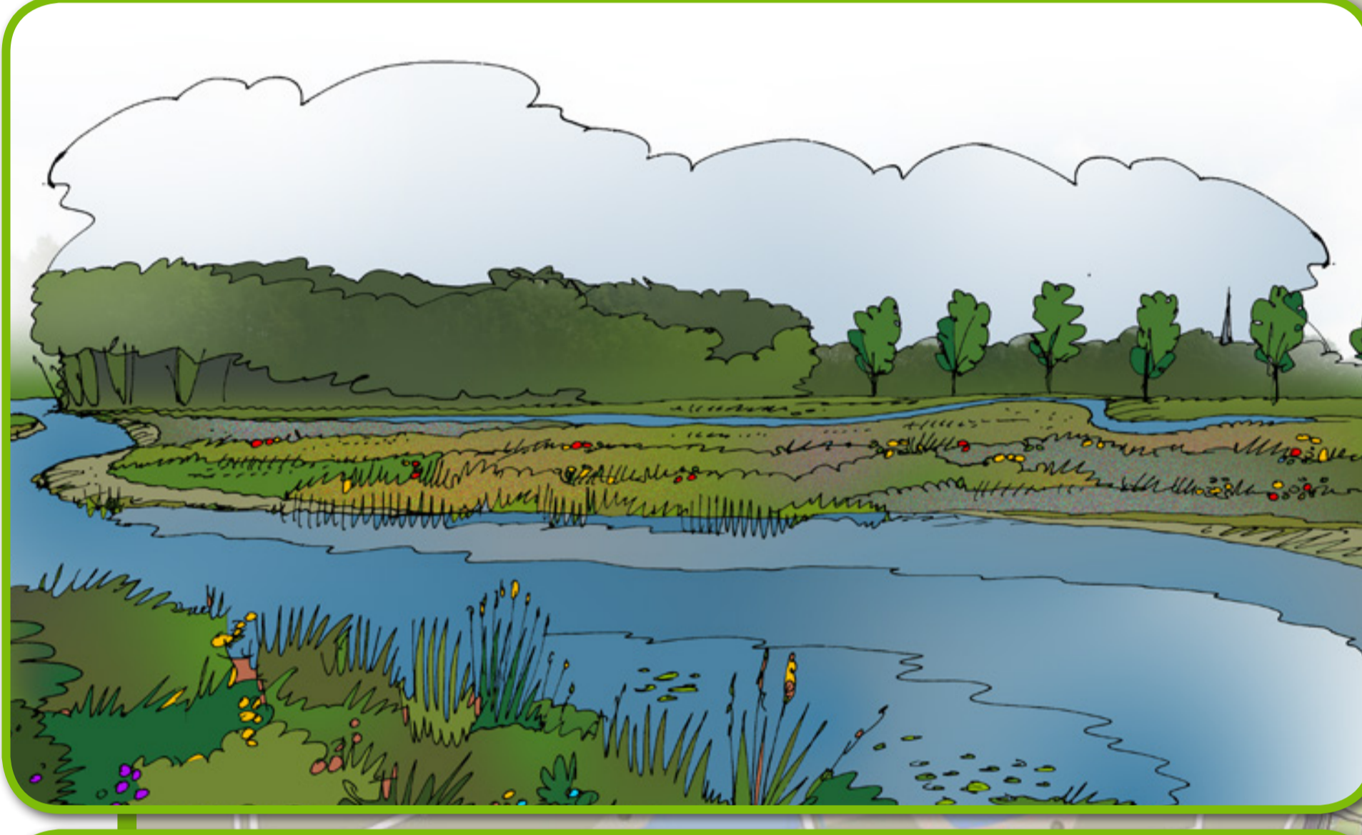
MEANDERENDE CHAAMSE BEEK DIE UITKOMT IN DE MARK, OEVERS MET KRUIDEN- EN FAUNARIJK GRASLAND