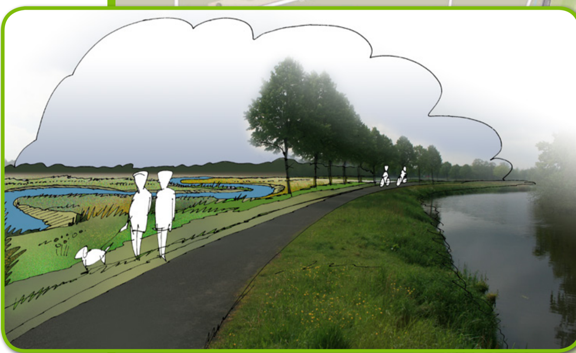
KOEKELBERG- EXTRA MEANDERS OP OOSTOEVER NAAST BESTAANDE LOOP IN KRUIDEN- EN FAUNARIJK GRASLAND