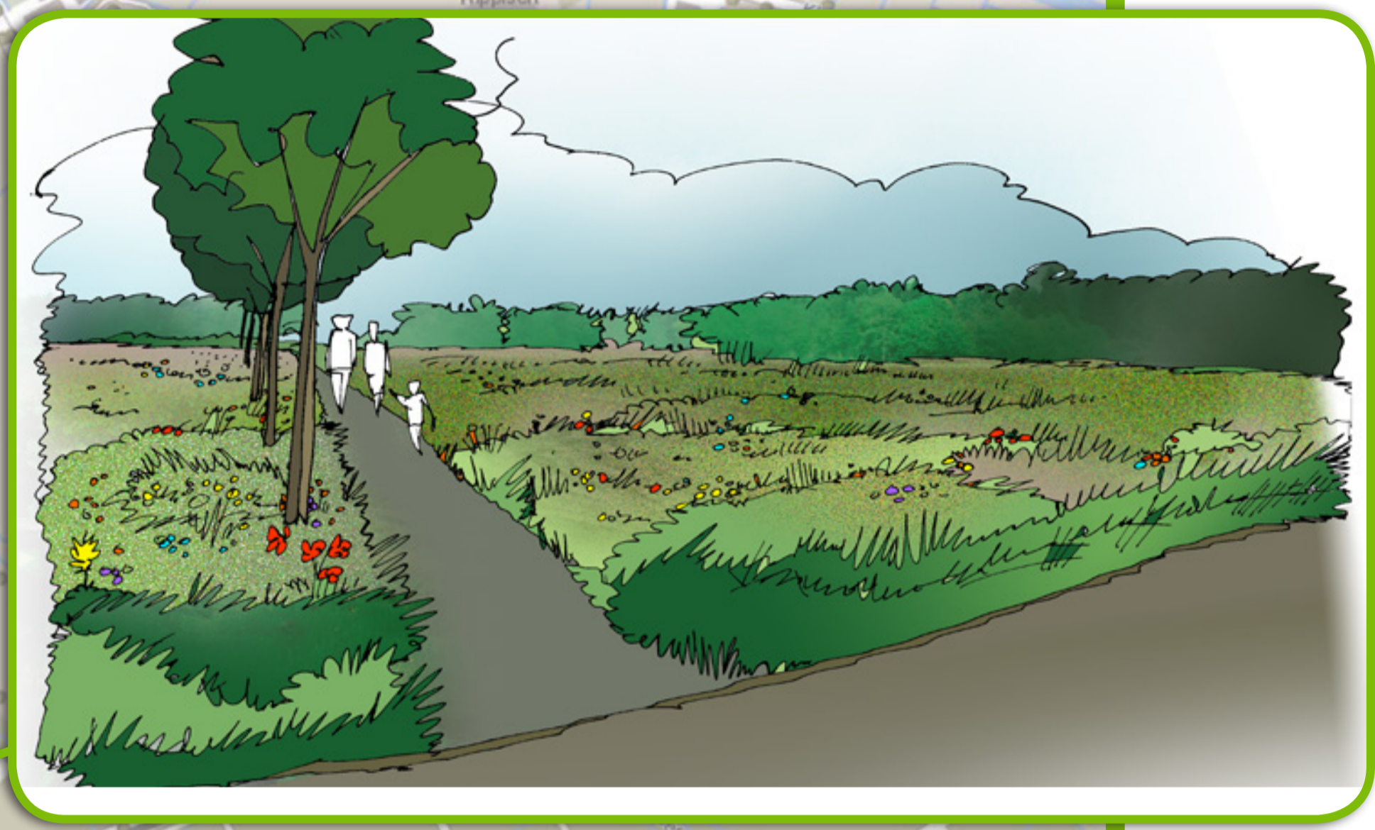
LANGS ULVENHOUTSELAAN: WANDELPAD EN DROGE ECOLOGISCHE VERBINDING MET ULVENHOUTSE BOS