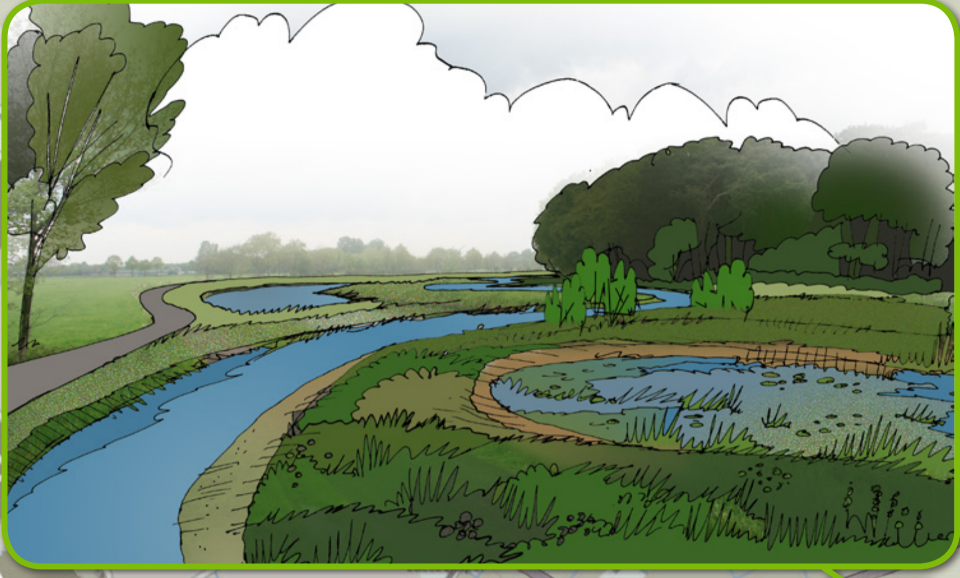
TEN ZUIDEN VAN VONDERPAD: MOERASACHTIGE LAAGTE MET OPEN WATER OP PLAATS OUDE LOOP, EXTRA MEANDERS OP WESTOEVER